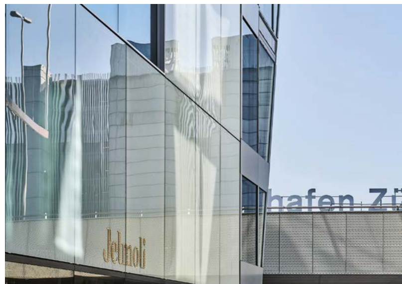
Jelmoli beauftragte Mint Architecture mit dem Fassaden- und Endausbau.