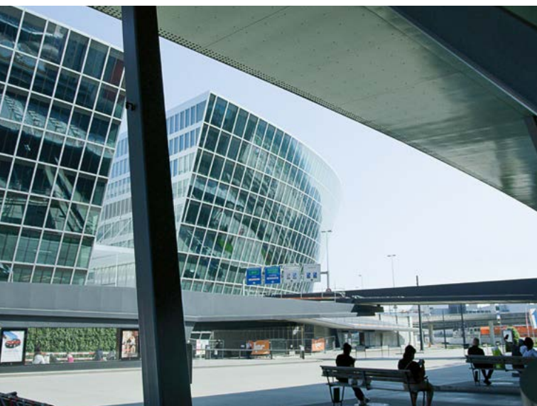
«The Circle» wurde im November 2020 fertiggestellt.

Das Spiel mit den Materialien, Texturen und dem Licht wird von Mint Architecture in den beiden Store Concepts weitergeführt. Es entstehen zwei eigenständige Häuser, die dank überraschender Aus- und Einblicke im Dialog zueinanderstehen und dabei Individualität in der Einheit zelebrieren. Die Architekten definieren auf der Basis der Customer Journey die Grundrisse, Materialisierung, Möblierung und die Warenpräsentation für ein einzigartiges Shoppingerlebnis.